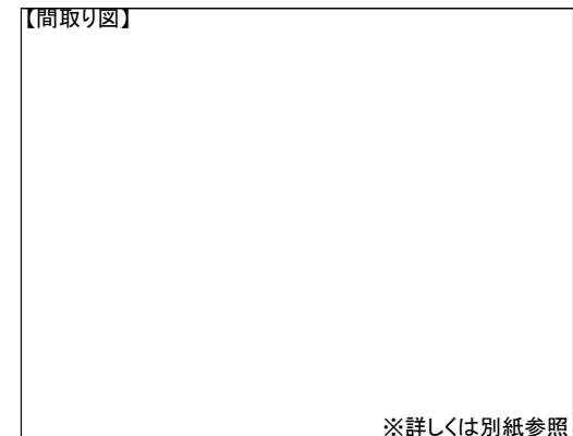
※詳しくは別紙参照