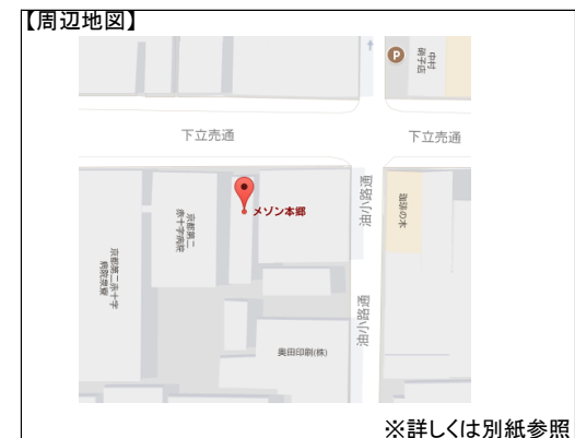
※詳しくは別紙参照