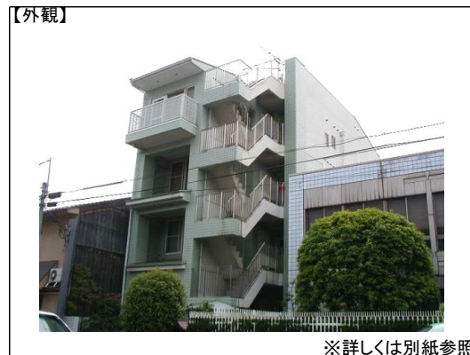
※詳しくは別紙参照