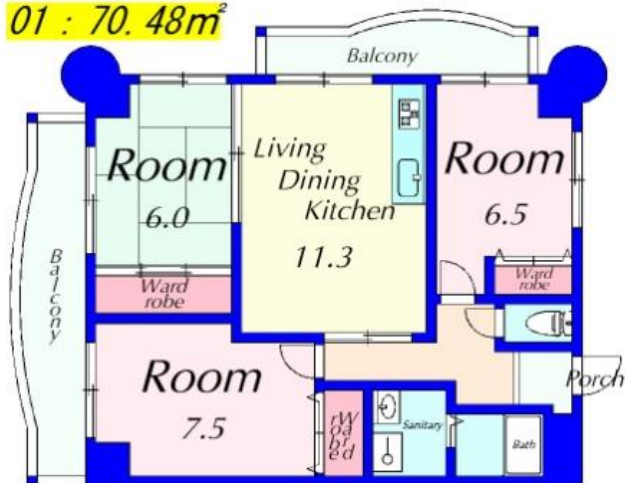
01 : 70.48m 2