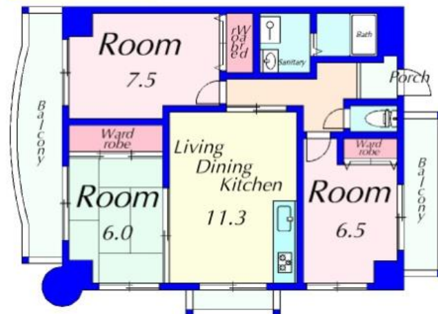
02 : 70.48m 2